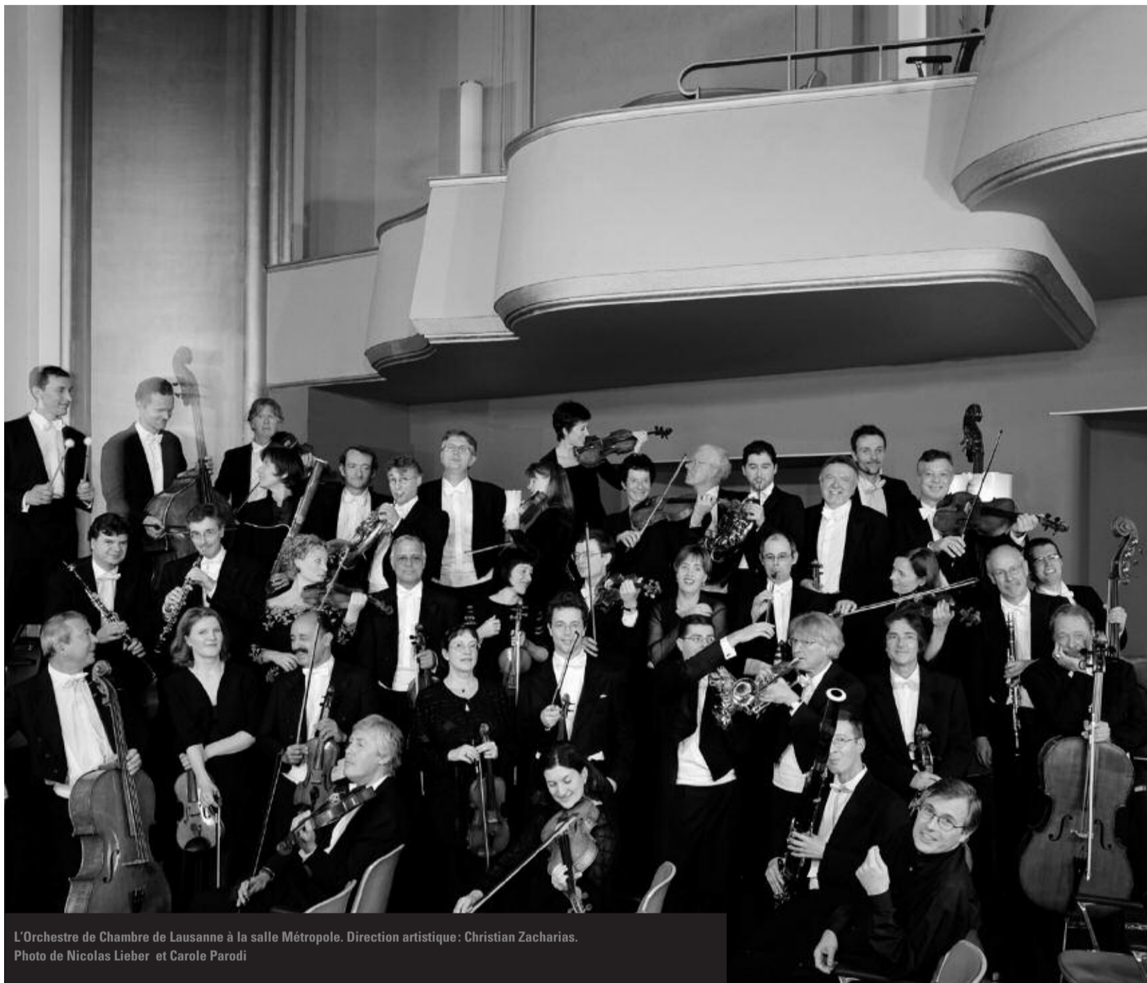
L'Orchestre de Chambre de Lausanne à la salle Métropole. Direction artistique: Christian Zacharias.